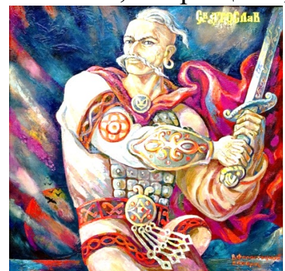
В. Форостецький "Святослав"

Се бо сядьмо на землю і візьмемо перстами до рани своєї, і товчем до неї, аби по смерті своїй станемо перед Мар-Морією, і рекла б: "Не маю винити того, яко єсь повнений землею, і не можу його одділити од неї". І Боги суці там да речуть про те: "Се єсь русич і пребудеш тим, яко взяв єсь землю до рани своєї і несеш її до Нави". (ВК, 376).