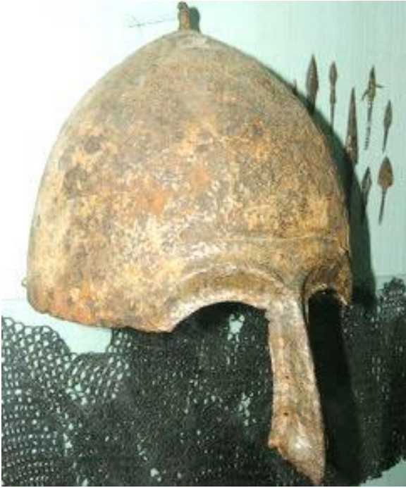
Давньоруський шолом. Надбрівні дуги і перенісся мають образ Матир-Сви.

Вислів з Велесової Книги " і побачите Птицю тую на чолі вашому " можна пояснити як те, що Мати Слава очолює все військо, але можна зрозуміти у прямому значенні, що її образ є на чолі, тобто шоломі русів. І дійсно, часто шоломи посеред мають планку на перенісці – це тіло птахи, а надбрівні дуги – позначають крила.