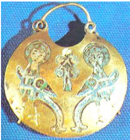
Колт 12 ст. із зображенням Матир-Сви. (Житомирська обл.). Крила-щити.

Суне, що віз з волами єсть там і жде його на Молочній Стезі. Як тільки Зоря проллється в степи, позвана Мати, аби Сва поспішила. [2, ВК,7ж].