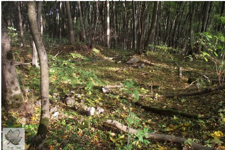
вид на місце, де орієнтовно було капище

квадратну форму із закругленими кутами, орієнтованими за сторонами світу (зверху розміри ями 1,6 x 1,7 м, до дна стінки ями звужуються), перед нею - майданчик з обпаленою поверхнею, на якому лежить кам'яна плита. Інші ями розташовані на терені капища, так і коло нього, вони мали різну форму, в частині з них знайдені залишки вогнищ, різноманітні речі (наприклад, ніж, замок, ключ, стремено, шпори, писанки, посуд, серп, коса, ножиці, кресало та інші), прикраси, в деяких — кістки тварин та людей (використані після розкладання тіл, що нагадує ритуали галлів) [5], [6], [7].