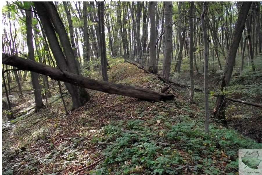
вал городища Звенигород. Колись тут на спеціальних майданчиках горіли вогнища

Вал 1 має ширину 8 м, висоту (від основи) 1,8 м. Під час розкопок встановлено, що він будувався протягом довгого часу, містить кераміку 5-6 ст.до н.е., черепки празької культури 6-7 ст.н.е. та 12 ст.. Виявлено майданчики, на яких тривалий час горіли вогні (шар попелу коло 30 см в товщину). Вал 2 має ширину 9 м, висота від основи 1,8 м. Знайдено кам'яну кладку, обпалену глину, черепки «скіфського» часу та 12 ст., численні речі, значний майданчик, на якому довго горів вогонь. У зовнішньому рові цього валу також виявлено майданчик, мощений каменем. Ще один вал має ширину 10 м, висота (від основи) 2 м. Внутрішній рів має ширину 2,5 м і глибину в материк 1,2 м, колись його стінки були ступінчасті, дно місцями обпалено і покрите вугіллям. Насип валу споруджений в кілька заходів: спочатку основа з глини, потім глина з каменем. Із зовнішнього боку в валі вирізана сходинка шириною 3,6 м, що була частиною складної конструкції, в якій горіли вогнища. На вершині валу є великі камені, частково обпалені [5], [6].