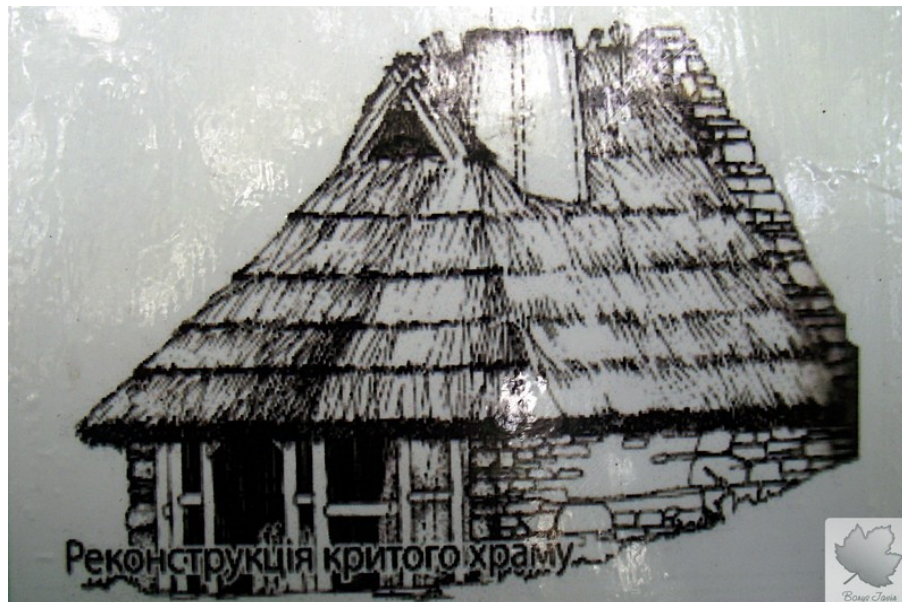
сучасна реконструкція храму