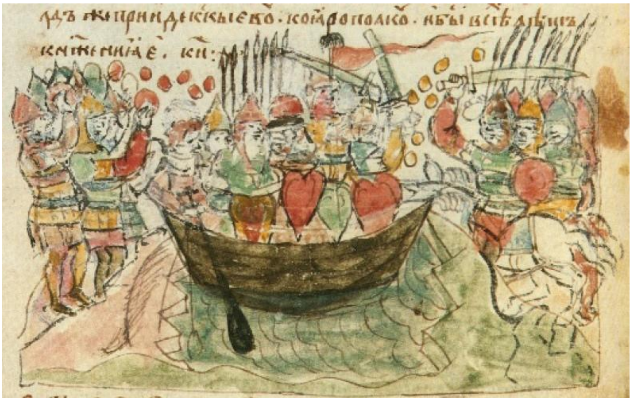
Лодії Святослава Ігоровича печеніги закидають камінням на Дніпрових порогах Радзивилівський літопис (Порівняємо з шумерською мітологічною битвою камінням Енкі з Куром, див. нижче)

У РІК 6480 [972]. Прийшов Святослав у пороги, і напав на нього Куря, князь печенізький. І вбили вони Святослава, і взяли голову його, і з черепа його зробили чашу, – окувавши череп його золотом, пили з нього. Свенельд же прийшов у Київ до Ярополка. І було всіх літ княжіння Святославоного двадцять і вісім [Літопис руський 1989, 43]".