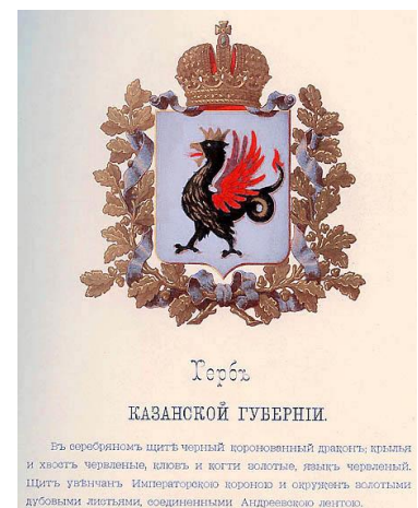
Герб Казанської губернії

На сході був шанований цар зміїв Зілант. В татарських легендах та казках це є мітологічна істота, що має образ дракона чи змія, вона мешкала на горі біля ріки Казанки, де вона впадає у Волгу. Зілант порівнюється з Василіском та іноді нагадує дракона-півня. Спочатку зображення Зіланта було відмітним знаком печатки казанського хана. Після завоювання Казані Московський цар Іван Грозний переніс його на державну печатку. В 1781 році царським указом Зілант був розміщений на гербі Казанської губернії [Зилант].