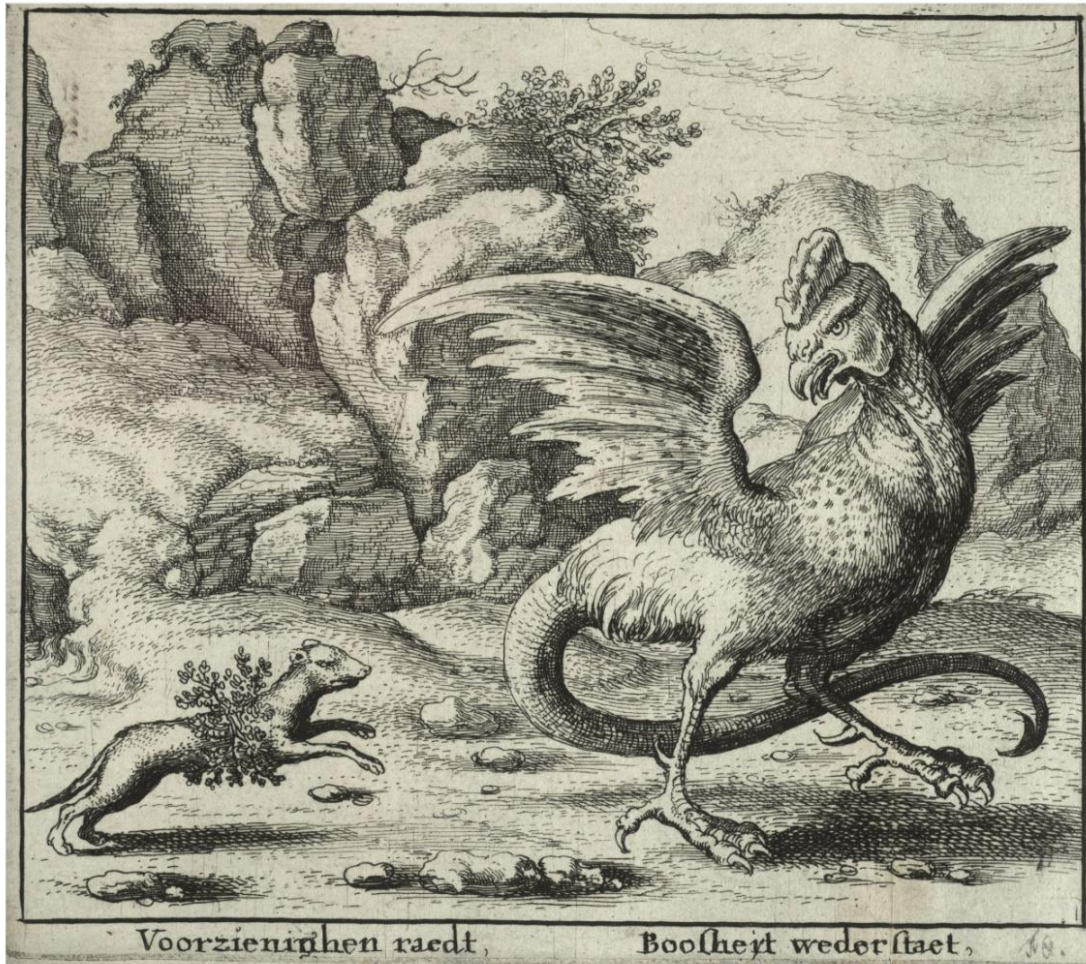
Посидинок тхора з Василіском (The basilisk and the weasel) Гравюра Холлара, XVII ст. (Wenzel Hollar (1607–1677)) [Василіск].

За легендами тільки тхір може подолати Василіска. Битва тхора з Василіском є класичною, вона зображена на кількох середньовічних малюнках. Це відповідає природній сутності тхора, як винищувача курей. Острів Хортиця, що стоїть напроти Дніпрових Порогів іноді за формою і за назвою ототожнюється із тхором [Пашник/Духовне 2007, 120].